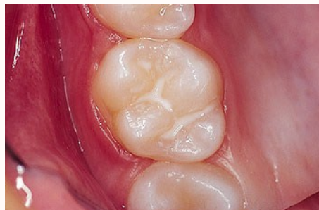
Schutz vor Karies: Versiegelung der feinen Grübchen auf der Kaufläche

Bei der Versiegelung werden die Fissuren mit einem hellen Kunststoff dauerhaft verschlossen, so dass an diesen Stellen keine Karies mehr entstehen kann (siehe Abb. unten).